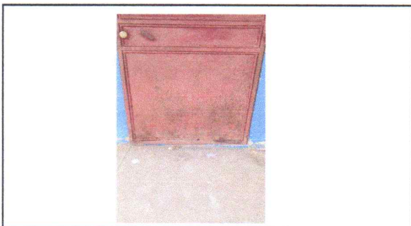
FOTO 3: Mantenimiento a estructura (lijado, cambio de tubo, cepillado, sujeciones y aplicación de pintura)